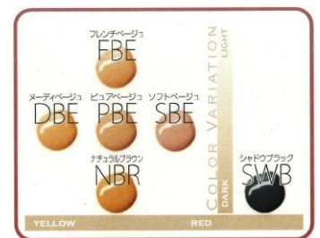
肌の色に合わせたカラーバリエーション