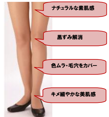
肌トラブルを自然にカバーし ナチュラルな素肌美を演出

さらに、編み目の糸同士が重なり合う部分を熱で融着させたノンラン設計にすることで、穴が開いても広がりにくい品質に仕上げました。その他、抗菌防臭・消臭加工、ヒップ立体設計、つま先補強といった機能も備えています。