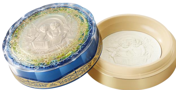
ミラノコレクション ボディフレッシュパウダー2021