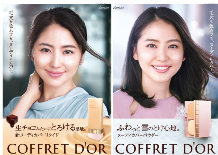
<リクイドファンデーション=生チョコ>

TVCM・サンプリング・店頭ツールのほか、Web 媒体でも積極的に、気持ちよい感触で肌に一体化することをアピール。“ヌーディカバー”の説得力を高め、ブランドのファンづくりを進めます。