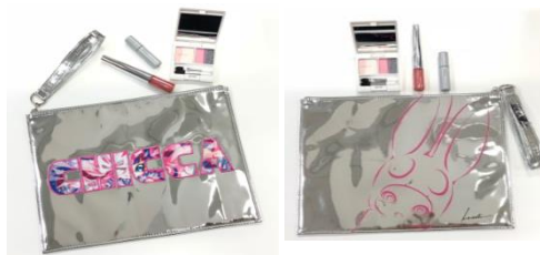
表 裏 オリジナルポーチ (W28cm×H22cm)