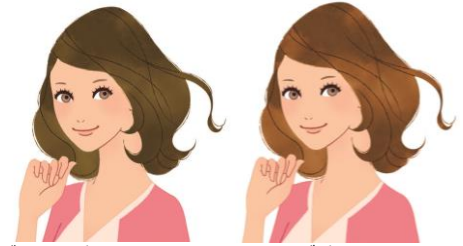
<ブラウン系のヘアカラー> <ローズ系のヘアカラー>

大人の女性の髪悩みのトップは、なんといっても白髪です。40代以降の女性は白髪を染めている方が多いようです。ところで、自分に合うヘアカラーの色はどのように選んでいますか？髪の色ひとつで、全体の印象はがらりと変わるもの。今回は、自然な印象に仕上がるヘアカラーの色選びについて、アドバイスします。