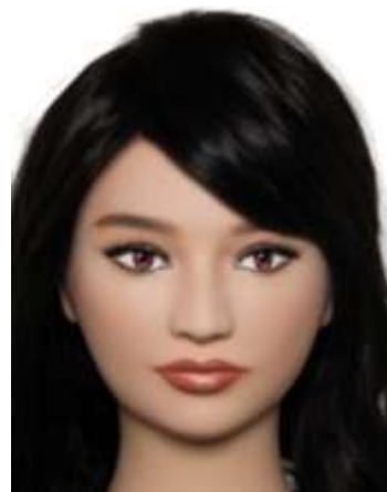
眉と目の距離が近い = 目もとのホリが深い印象