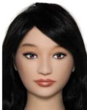
眉と目の距離が離れている = のっぺりとした印象

眉と目の距離で印象は大きく変わります (同じモデルに、眉と目の距離を変えてメイクしています)