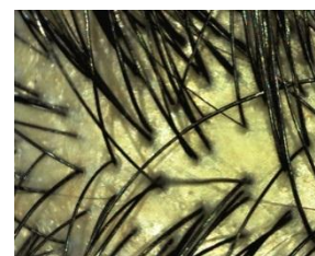
▲健やかな頭皮と髪