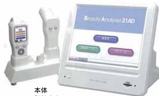
本体 肌拡大カメラ 肌測定センサー（コードレス）

さらに、現行の「ビューティアナライザー21」から継承したすべての測定項目についても、測定精度を向上させました。