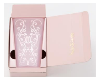
プレミアムの花器